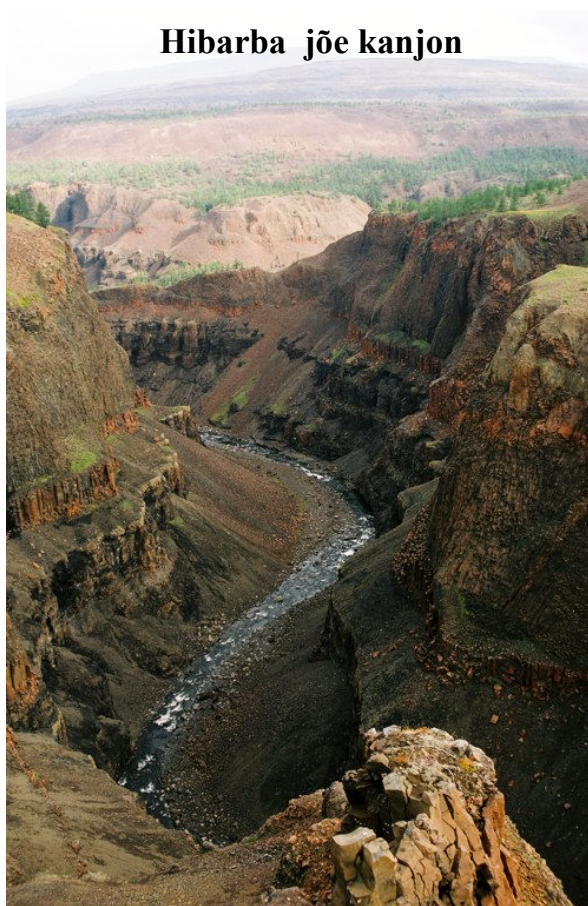
Hibarba jõe kanjon